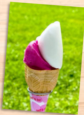
レークヒルファーム