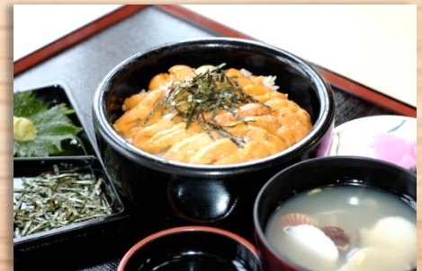
道の駅あぶた～ウニ丼