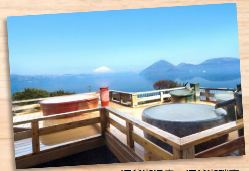
洞爺湖温泉～洞爺湖畔亭