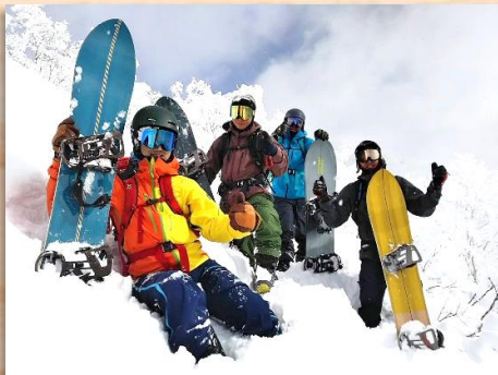
ニセコのスキー場