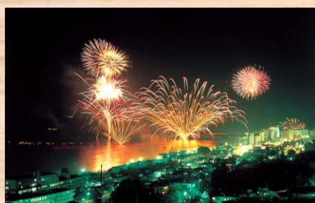
洞爺湖ロングラン花火大会